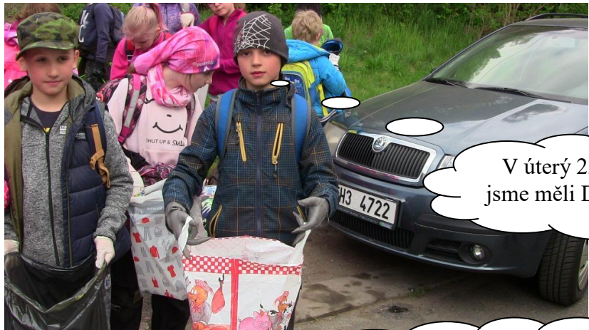
V úterý 23. dubna jsme měli Den Země.