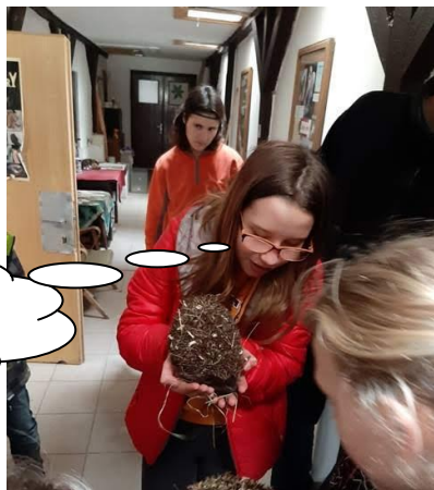
Byli jsme na exkurzi v záchranné stanici.