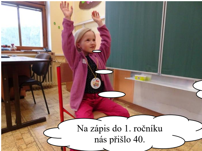
Na zápis do 1. ročníku nás přišlo 40.